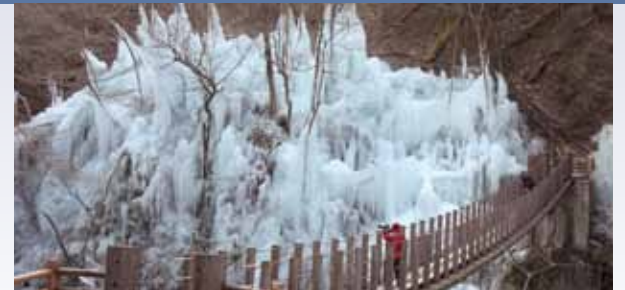
◆尾ノ内百景氷柱(小鹿野町) 期間:~2月下旬 8:00~16:00 【問合せ】西秩父商工会 ☎0494-75-1381