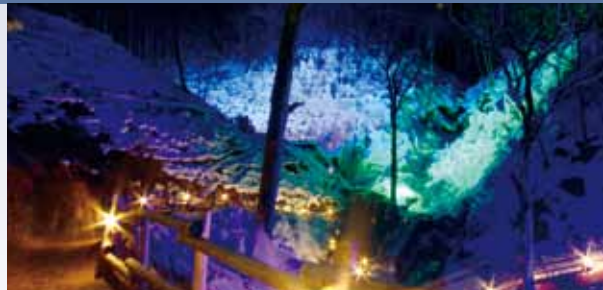
◆あしがくぼの氷柱(横瀬町) 期間:~2月26日(日) 9:00~16:00 【問合せ】横瀬町ブコーさん観光案内所 ☎0494-25-0450