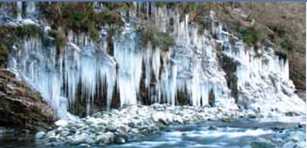
◆三十槌の氷柱(秩父市大滝) 期間:~2月下旬ごろ 【問合せ】(一社)秩父観光協会大滝支部 ☎0494-55-0707